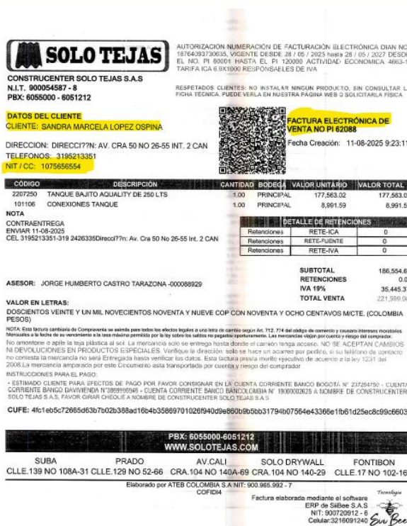
Imagen 6 Factura de venta expedida a nombre de funcionario del INM, egreso de caja menor 2325 del 21 de agosto de 2025.