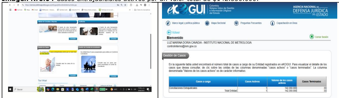
Imagen Nro.04 Casos extrajudiciales activos por un valor total de $142.350.000.

Dicha información fue consignada en la planilla de la Certificación de Control Interno, específicamente en la hoja correspondiente a Comité de Conciliación.