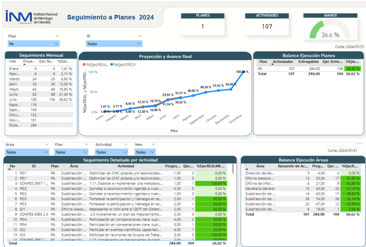
Imagen2: Cumplimiento y avance acumulado del plan de acción a corte del 30 de junio

Al corte del 31 de julio, el seguimiento al plan de acción reveló un cumplimiento acumulado total del 36.62% en comparación de lo esperado del 35.21% en todas las actividades por cumplimiento adelantado en meses anteriores.