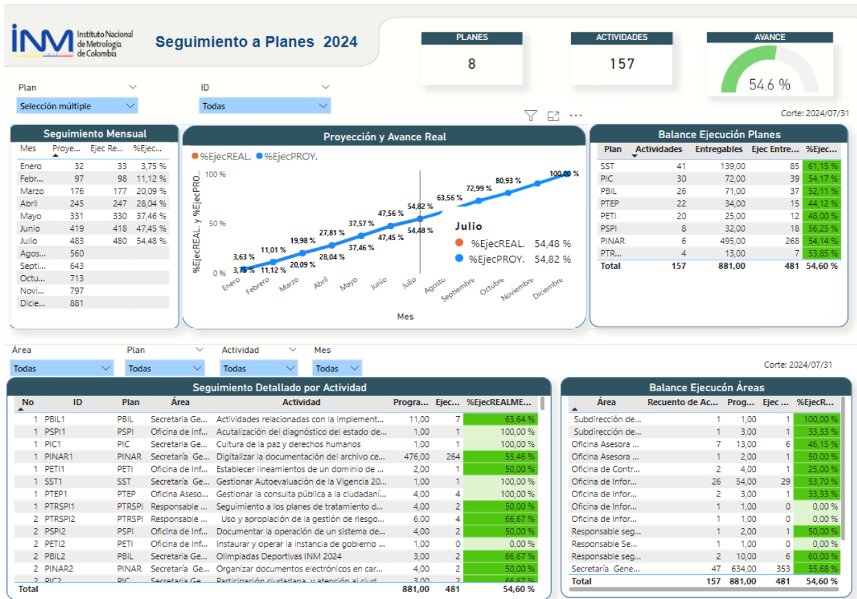
Imagen 4. Cumplimiento y avance acumulado Planes Institucionales a corte 31 de julio.

El seguimiento realizado a los planes institucionales, que se analizan mes a mes en función de sus actividades y entregables programados, se identificó un avance acumulado en el cumplimiento de los compromisos adquiridos por las áreas, la entrega de evidencias muestra un progreso del 54.48% en comparación de lo esperado del 54.82% entre los meses de enero a julio, teniendo en cuenta lo anteriormente mencionado.