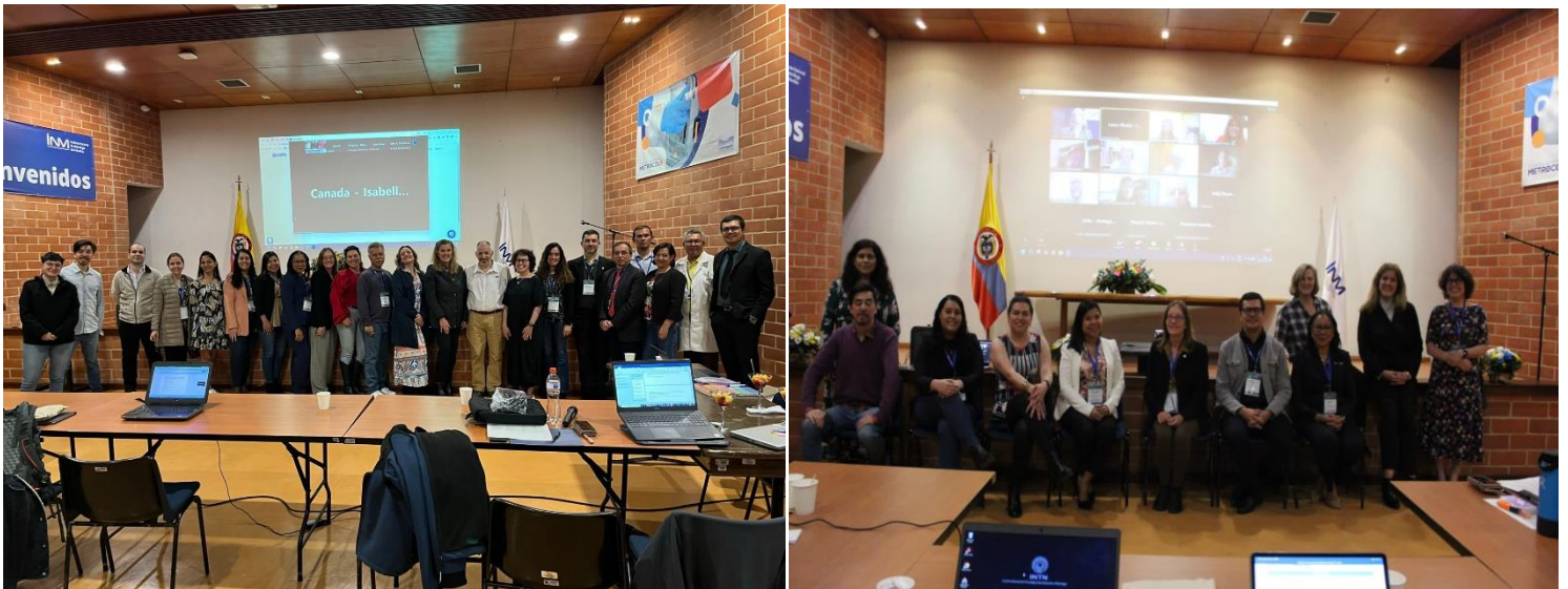
Imagen 2: Reunión Sistema Interamericano de Metrología -SIM