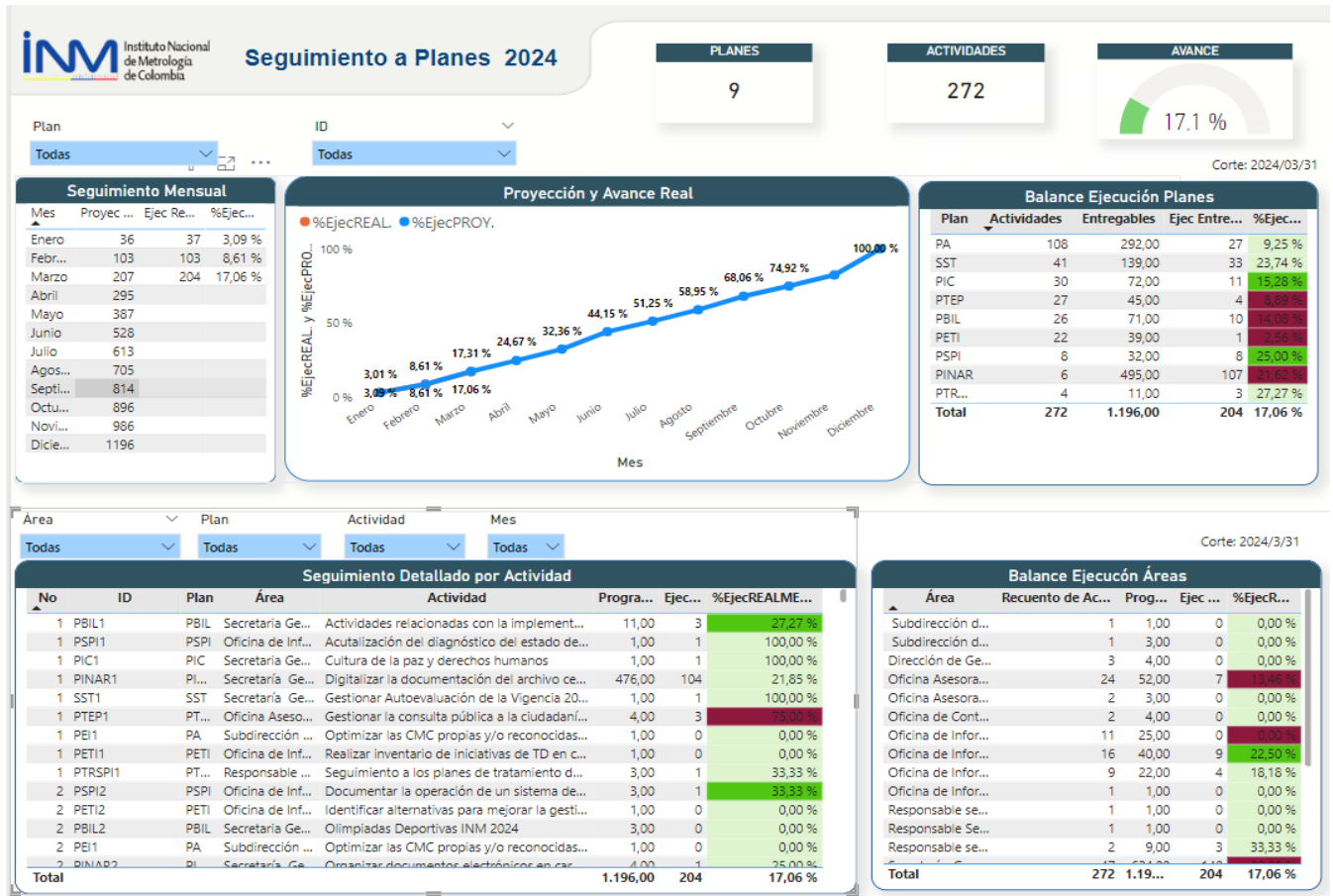
Imagen 2. Cumplimiento y avance acumulado a corte 31 de marzo.