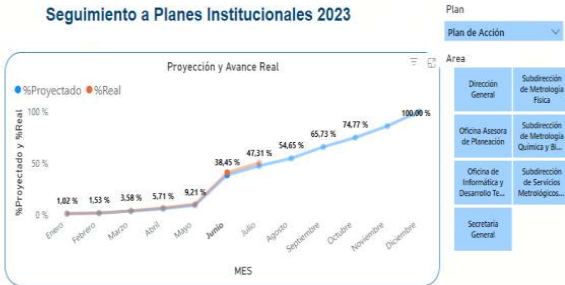
Imagen 2: Seguimiento plan de acción – Power BI