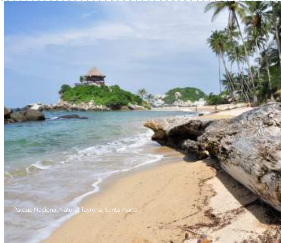
Parque Nacional Natural Tayrona, Santa marta